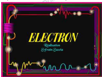
1-cliquer sur le mot Électron