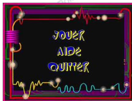
2-cliquer sur le mot Jouer