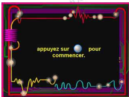
3-cliquer sur la petite bille