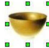
Les poignées vertes “montrent” que l’objet est sélectionné.

Il existe plusieurs méthodes, au clavier ou à la souris, pour préciser la zone concernée.